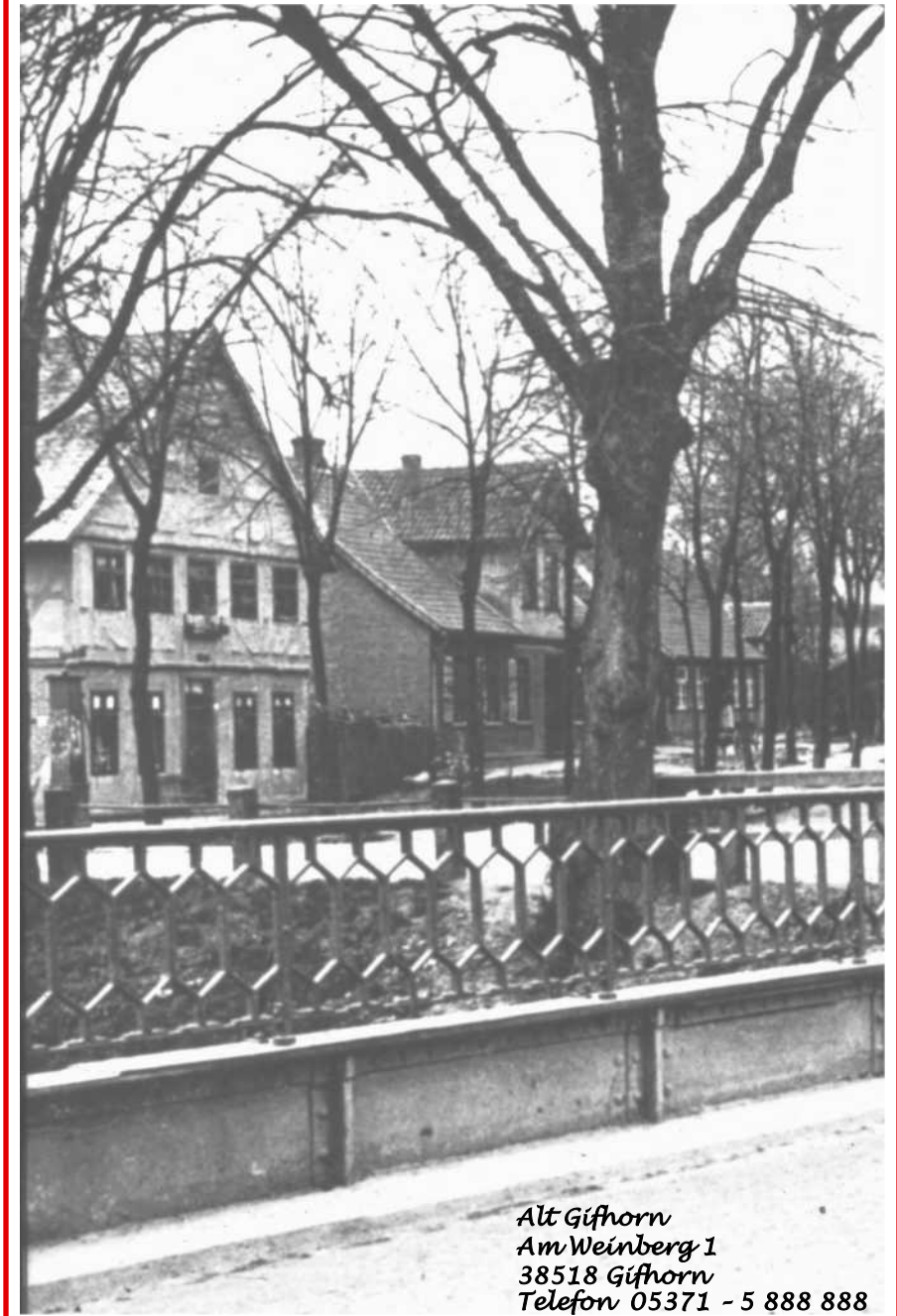
Alt Gifhorn Am Weinberg 1 38518 Gifhorn Telefon 05371 - 5 888 888